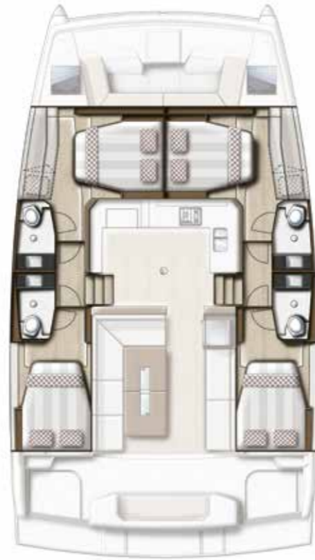
4 CABIN VERSION / 4 BATHS Version 4 cabines / 4 sdb