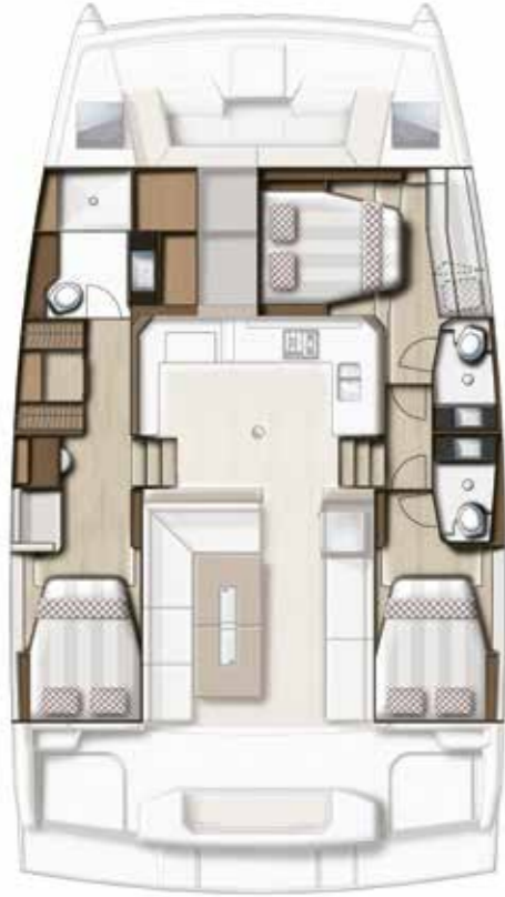
3 CABIN VERSION / 3 BATHS Version 3 cabines / 3 sdb