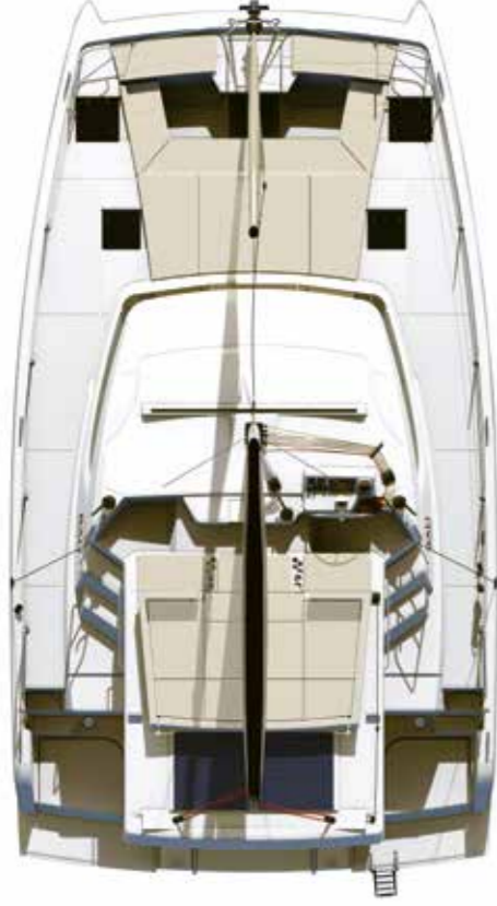
DECK AND FLYBRIDGE Pont et flybridge